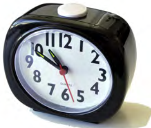
Ref : 21500605

50 € Montre parlante à aiguilles Nouvelle édition Modèle mixte. Réglée à l'heure avant envoi.