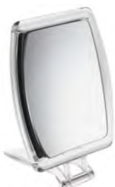
Ref : 21000069

59,90 € Balance parlante de cuisine Jusqu'à 3 kg par 1 gramme. Pile fournie