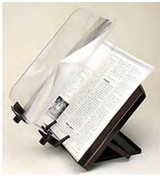
Ref : 21000023

199 € Loupe géante XXL avec pupitre Lentille 3D dimensions 30 cm x 25 cm. Pupitre inclinable.