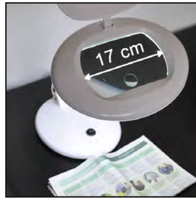
Ref : 21200501

199 € Loupe géante XXL avec pupitre Lentille 3D dimensions 30 cm x 25 cm. Pupitre inclinable.