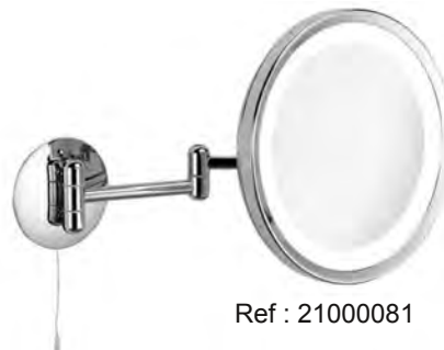
Ref : 21000081

59 € Miroir grossissant 10x pliable Double face : miroir simple et miroir grossissant. 15 cm x 10 cm