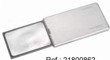
Ref : 21800862

99 € Lampe loupe LED Basse Vision Lentille 3D largeur 17 cm permettant vision du relief. Alimentation secteur.