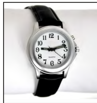
Ref : 21300532

79 € Loupe éclairante LED Okolux Plus Mobil 10D Lentille 10D 75 mm x 50 mm Piles fournies