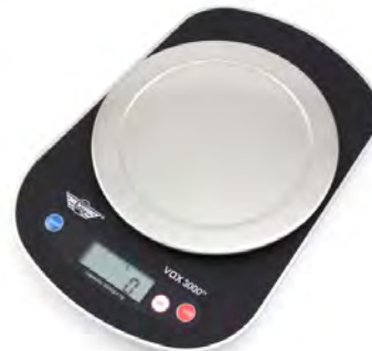
Ref : 21000127

79 € Téléphone portable grosses touches GSM compatible tout opérateur. Dim 115 mm x 50 mm x 13 mm. Touches 13 mm x 9 mm.