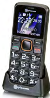
Ref : 21500273

25 € Cartes à jouer grands caractères Hauteur lettre 15 mm Jeu de tarot également disponible.