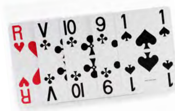
Ref : 21300537

69 € Réveil parlant à aiguilles Annonce Heure et Jour. Piles fournies