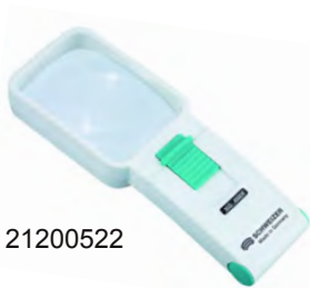
Ref : 21200522

79 € Loupe éclairante LED Okolux Plus Mobil 10D Lentille 10D 75 mm x 50 mm Piles fournies